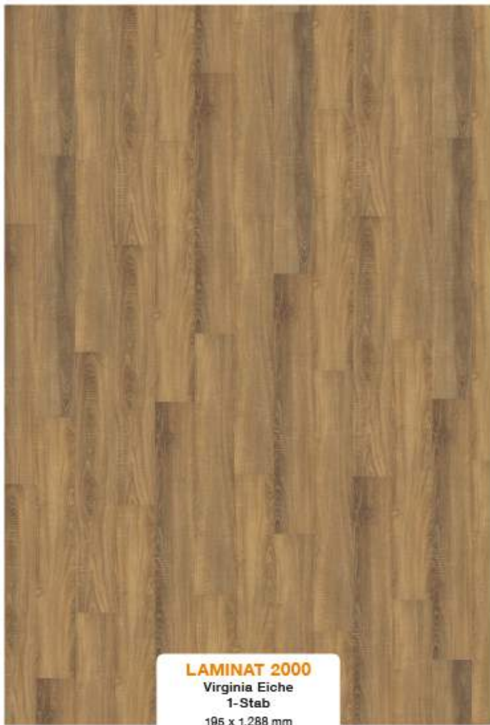
LAMINAT 2000 Virginia Eiche 1-Stab 195 x 1.288 mm