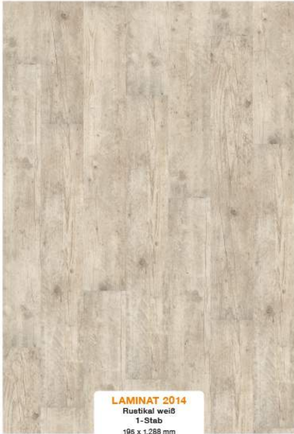
LAMINAT 2014 Rustikal weiß 1-Stab 195 x 1.288 mm