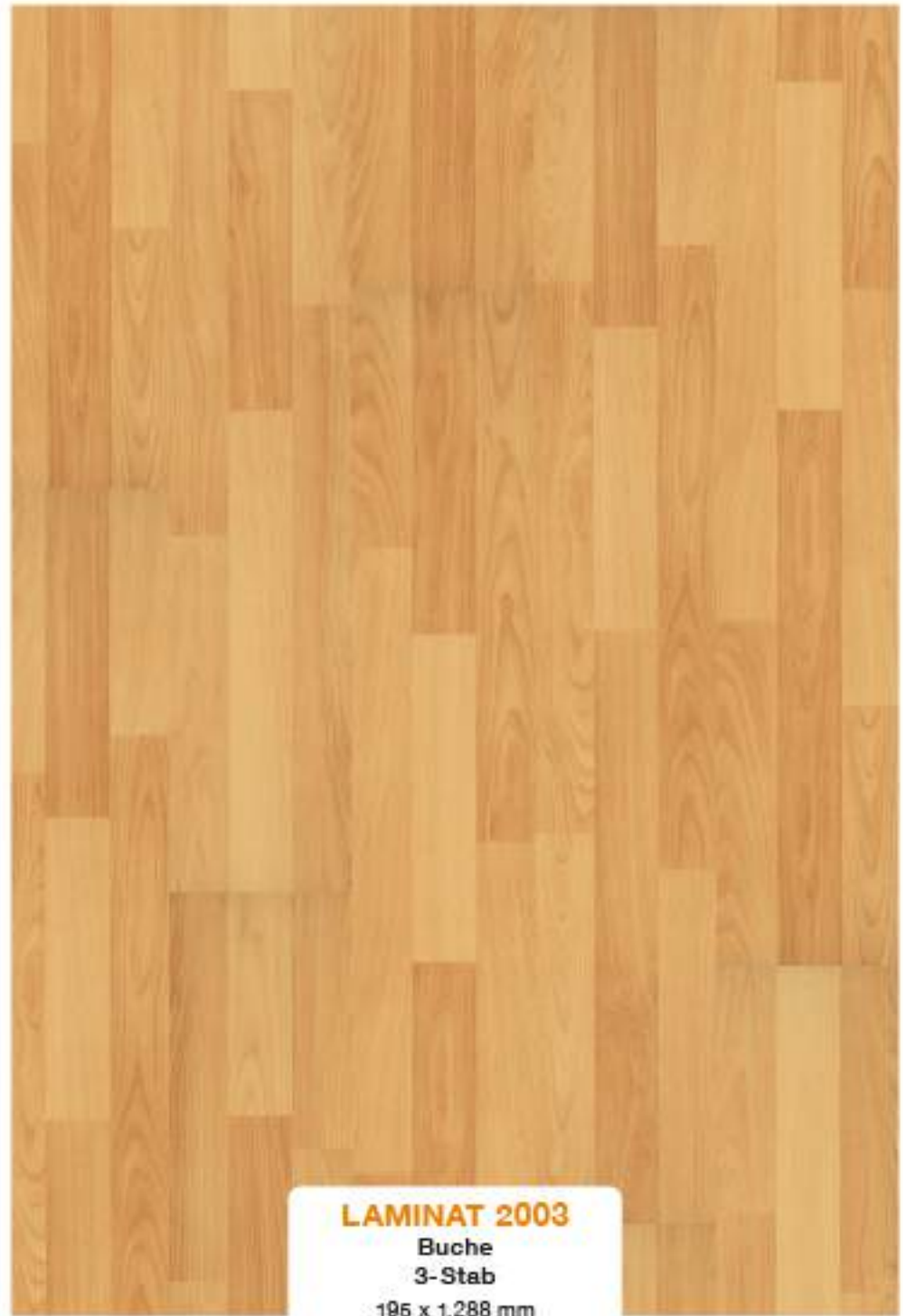
LAMINAT 2003 Buche 3-Stab 195 x 1.288 mm