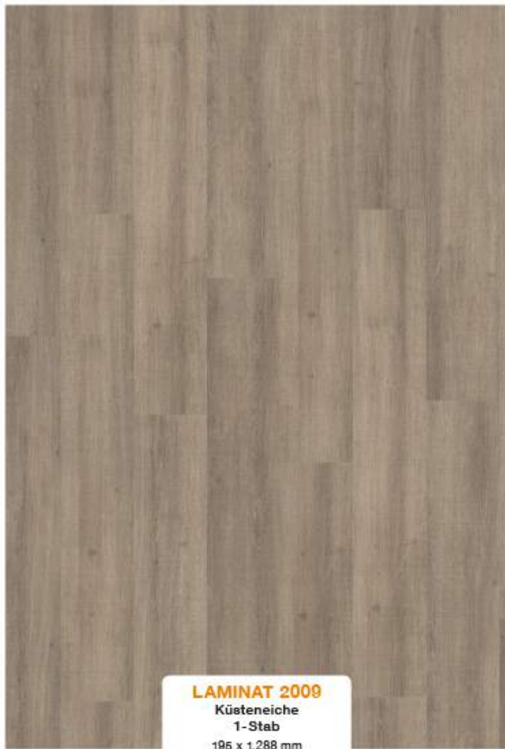
LAMINAT 2009 Küsteneiche 1-Stab 195 x 1.288 mm