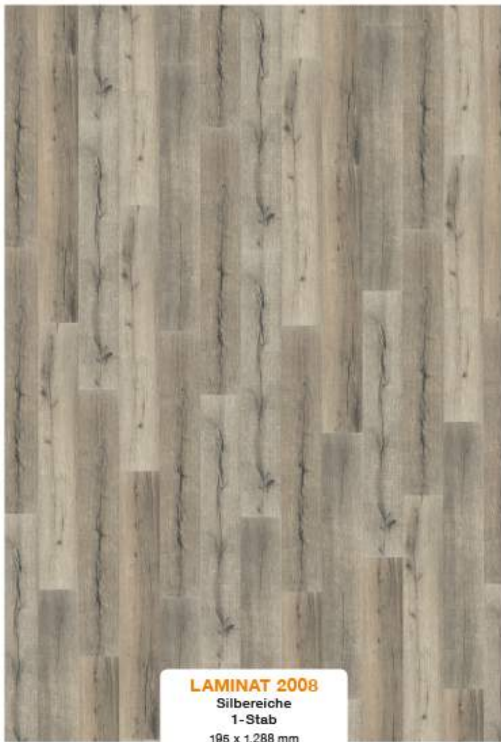
LAMINAT 2008 Silberliche 1-Stab 195 x 1.288 mm