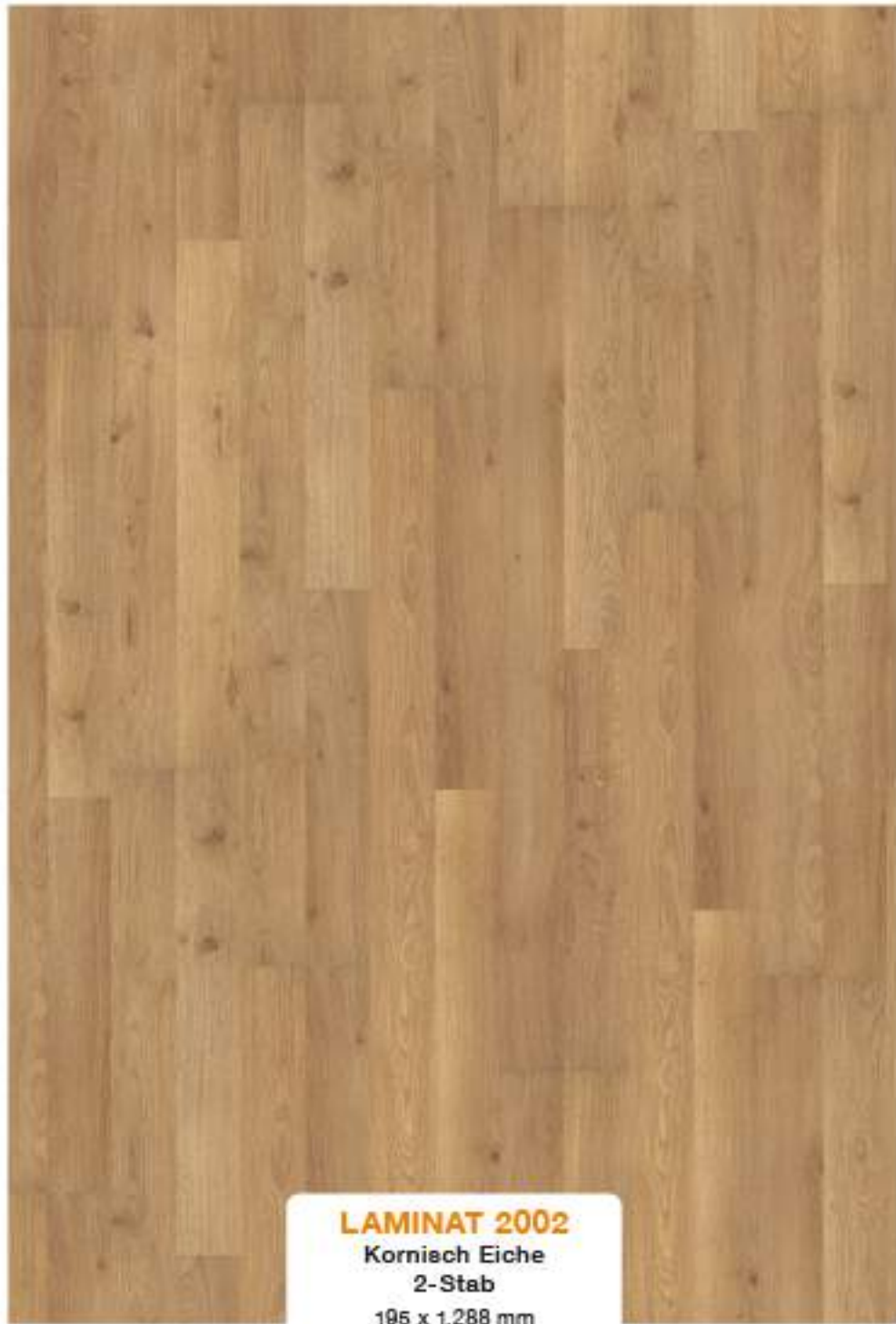
LAMINAT 2002 Kornisch Eiche 2-Stab 195 x 1.288 mm