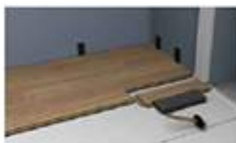
3. auch an schwer erreichbaren Stellen leicht zu verlegen