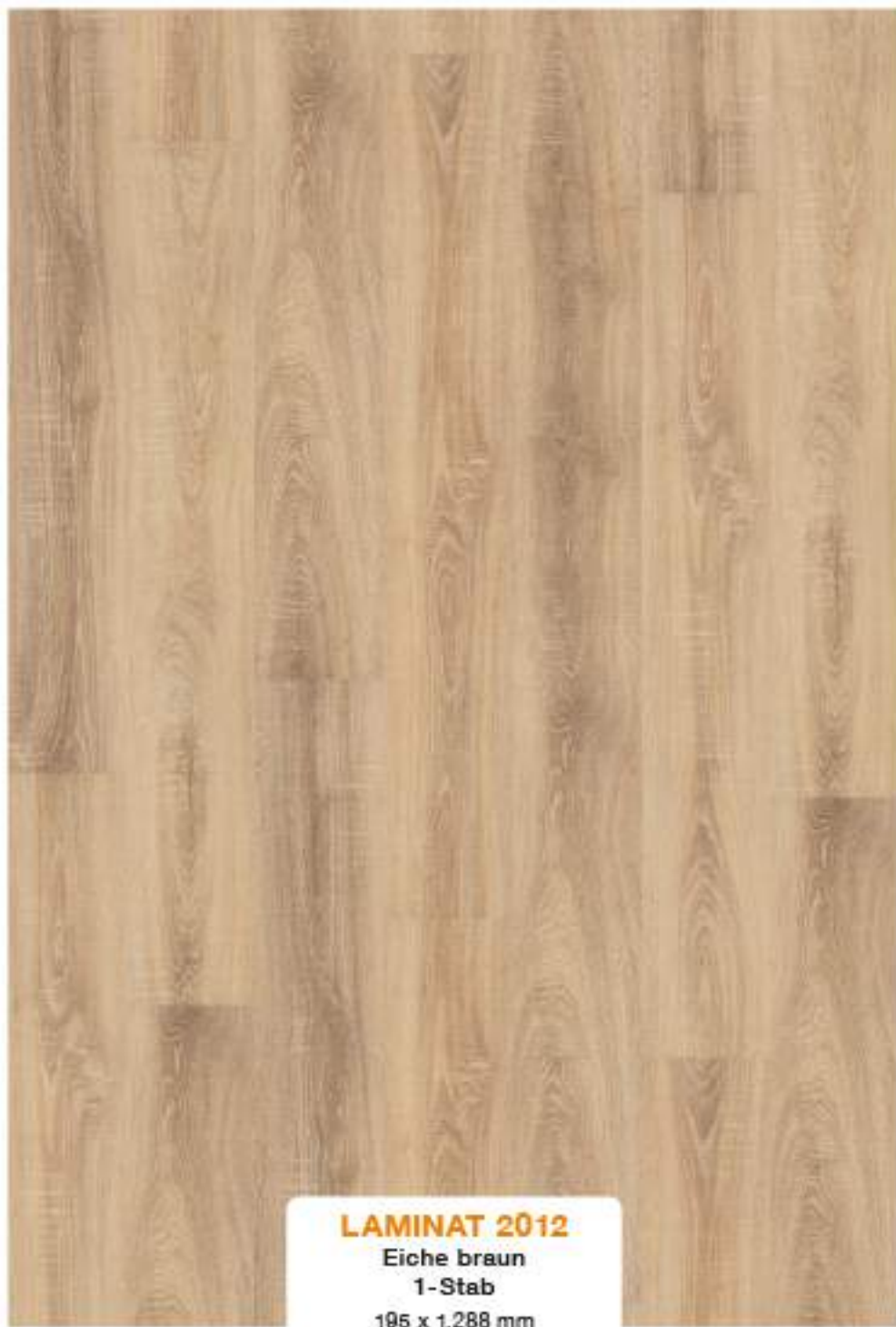
LAMINAT 2012 Eiche braun 1-Stab 195 x 1.288 mm