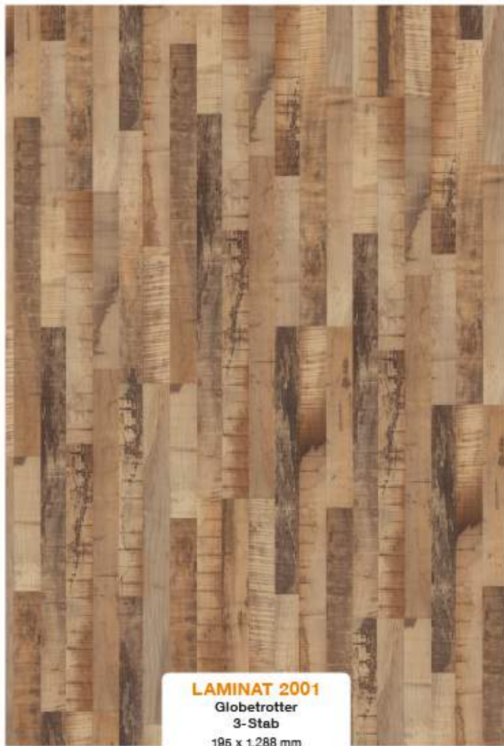
LAMINAT 2001 Globetrotter 3-Stab 195 x 1.288 mm