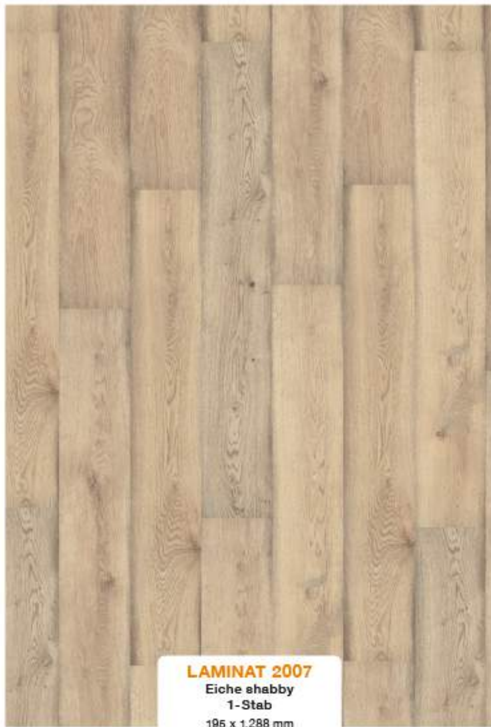
LAMINAT 2007 Eiche shabby 1-Stab 195 x 1.288 mm