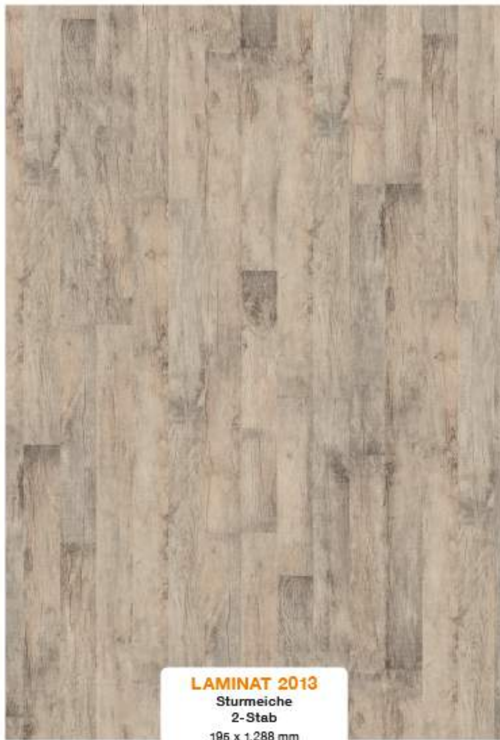
LAMINAT 2013 Sturmeiche 2-Stab 195 x 1.288 mm