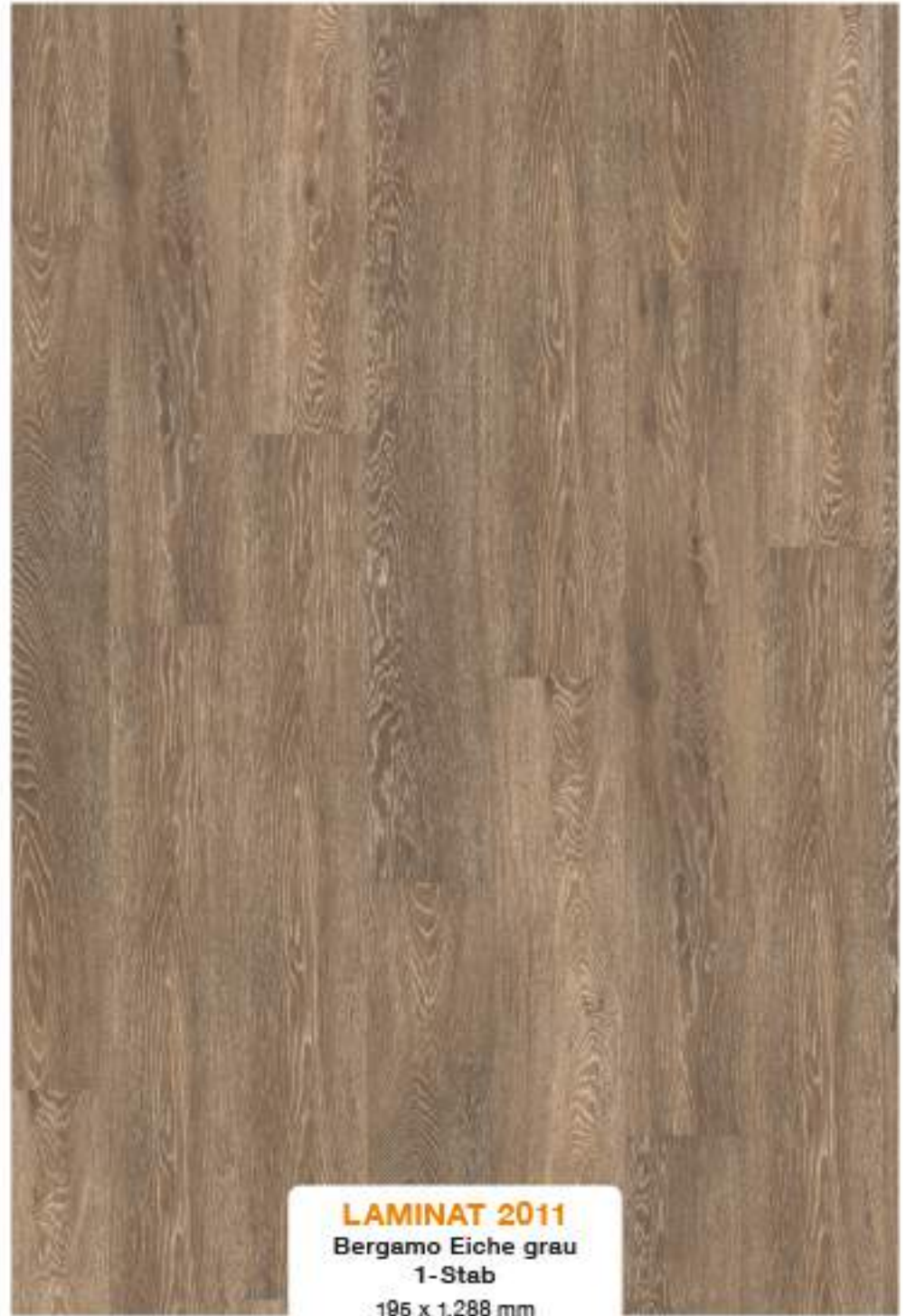
LAMINAT 2011 Bergamo Eiche grau 1-Stab 195 x 1.288 mm