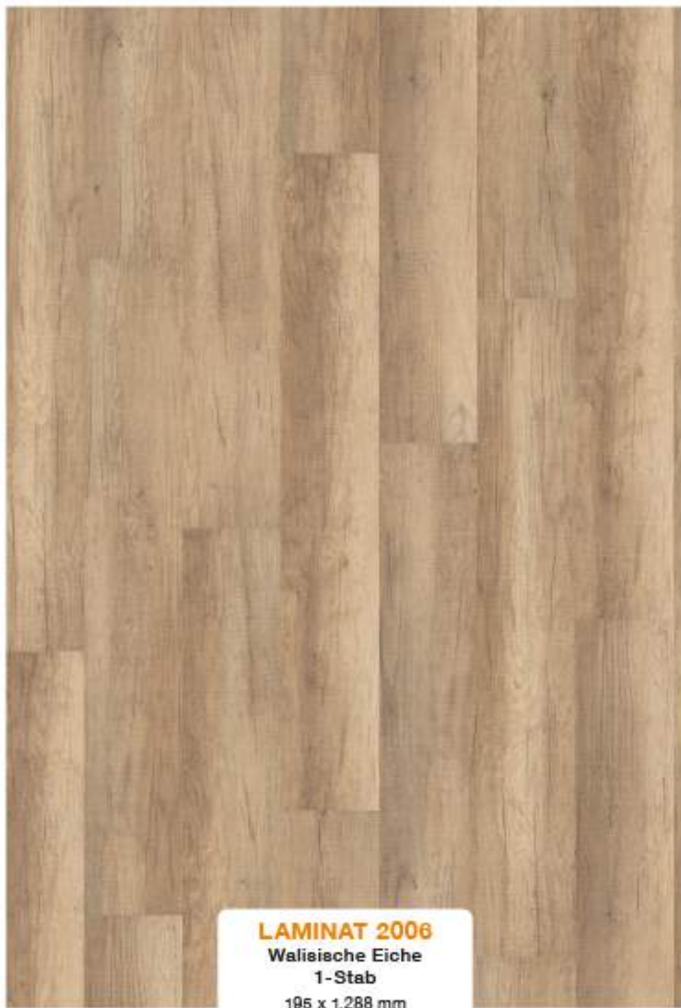
LAMINAT 2006 Walisische Eiche 1-Stab 195 x 1.288 mm