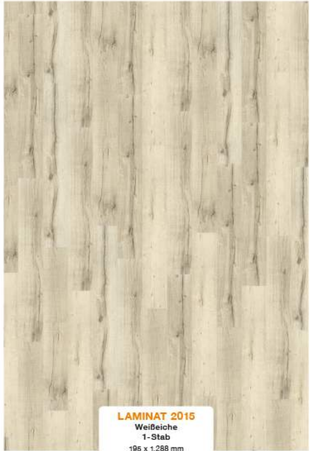
LAMINAT 2015 Weißbeiche 1-Stab 195 x 1.288 mm