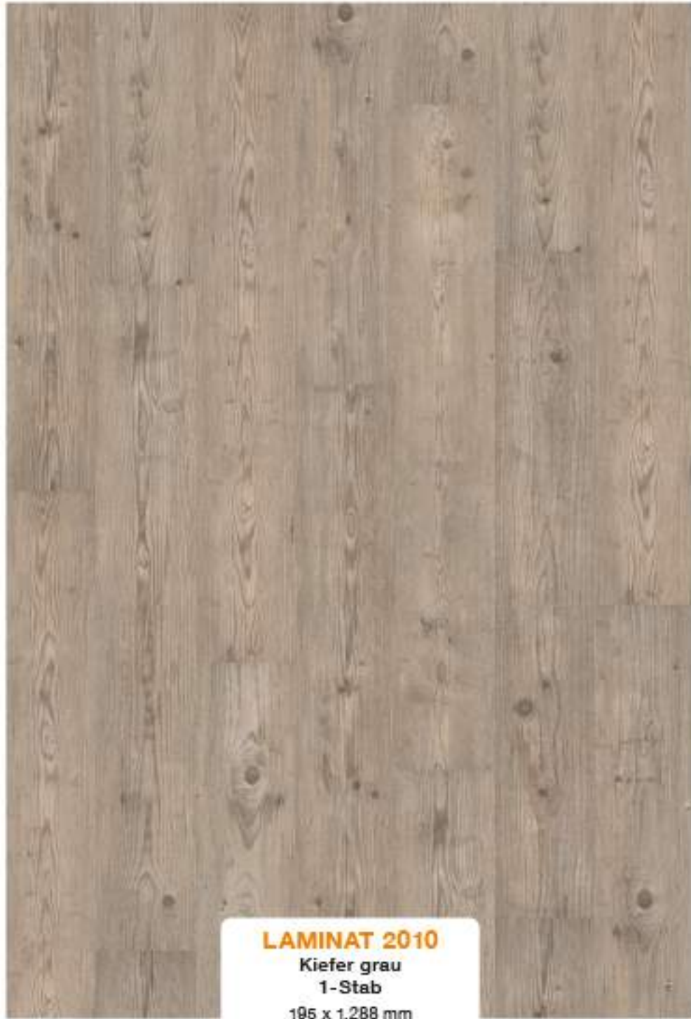
LAMINAT 2010 Kiefer grau 1-Stab 195 x 1.288 mm