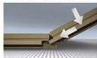
1. drehen und klicken